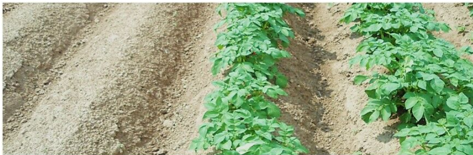
Izjemna učinkovitost in zanesljivost: SINOPIA + CHANON